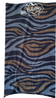
Tour de cou 3€